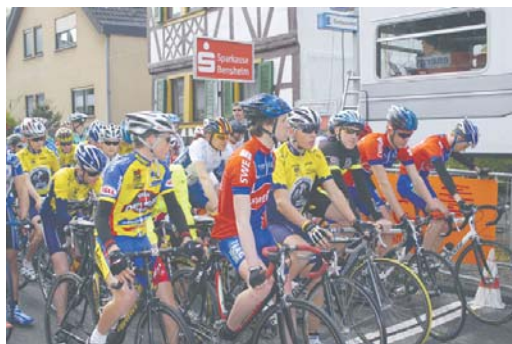
Gerade bei Schülern und Jugendlichen haben die Radrennen im Rahmen des ENTEGA energyCups rund um die Sparkasse in Einhausen einen hohen Stellenwert. Für viele war Einhausen der Beginn einer erfolgreichen sportlichen Karriere. Deutschlandweit genießt Einhausen einen exzellenten Ruf.